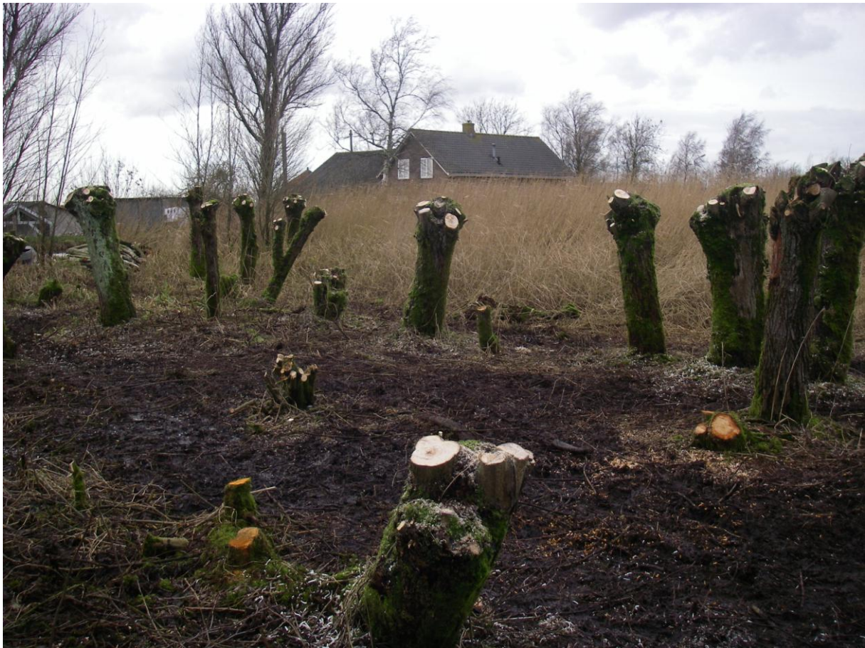
De werkplek na de werkdag van 1 februari 2014